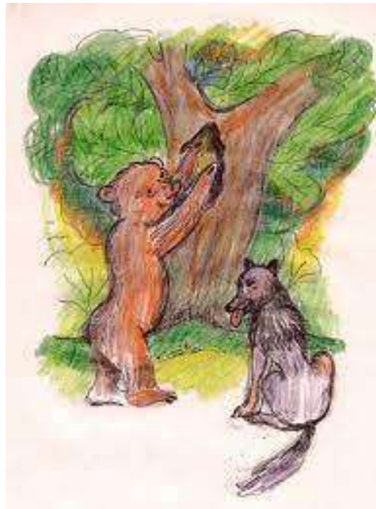
4. sz. kép