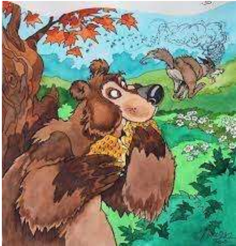
1. sz. kép

2. Tedd időrendi sorrendbe a képkockákat! (4 pont)