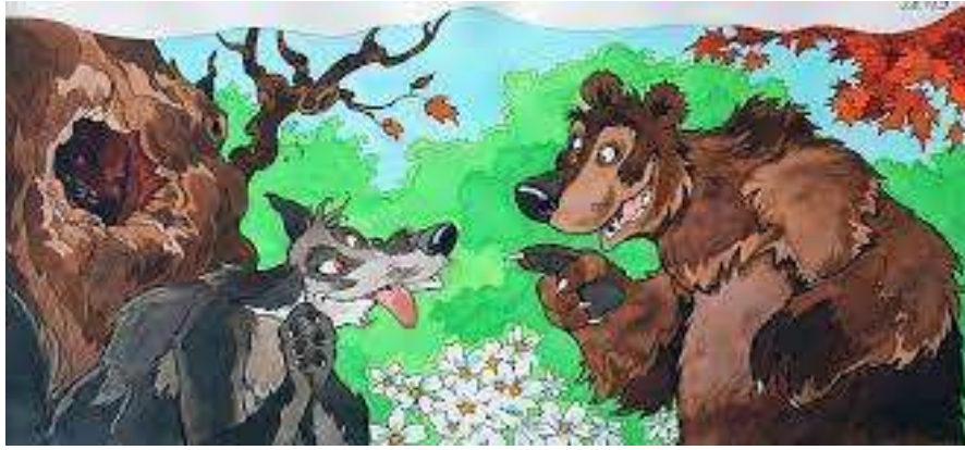
3. sz. kép